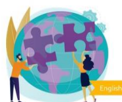
Module 4: Application of social Innovation and foundation of a...