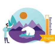
Module 2: Environmental and Climate Change Challenges