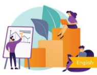
Module 5: Developing a social enterprise business plan