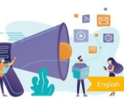
Module 7: Communicating your social enterprise