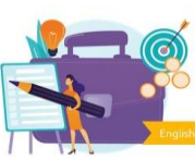
Module 8: How to handle the organizational aspects of a...