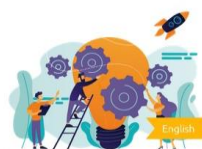
Module 1: Introduction to Social Entrepreneurship and Social...

Η καρδιά της πρωτοβουλίας μας, το πιλοτικό πρόγραμμα, αποτέλεσε φάρο καινοτομίας, εμπλέκοντας τους μαθητές με διαδραστικές μεθοδολογίες μάθησης που ξεπερνούν τα παραδοσιακά όρια. Υφαίνοντας τον ιστό της κοινωνικής επιχειρηματικότητας στην εκπαιδευτική εμπειρία, δεν διδάσκουμε απλώς, αλλά εμπνέουμε. Η προσέγγισή μας, η οποία χαρακτηρίζεται από την ενσωμάτωση διαδραστικών μίνι παιχνιδιών και της πλατφόρμας Virtual Social Enterprise, αντιμετωπίστηκε με ενθουσιασμό και περιέργεια, ανοίγοντας το δρόμο για έναν πιο βαθύ εκπαιδευτικό αντίκτυπο.