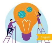
Module 3: Introduction to the design thinking