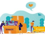
Module 6: Measuring social impact