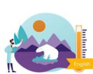
Module 2: Environmental and Climate Change Challenges